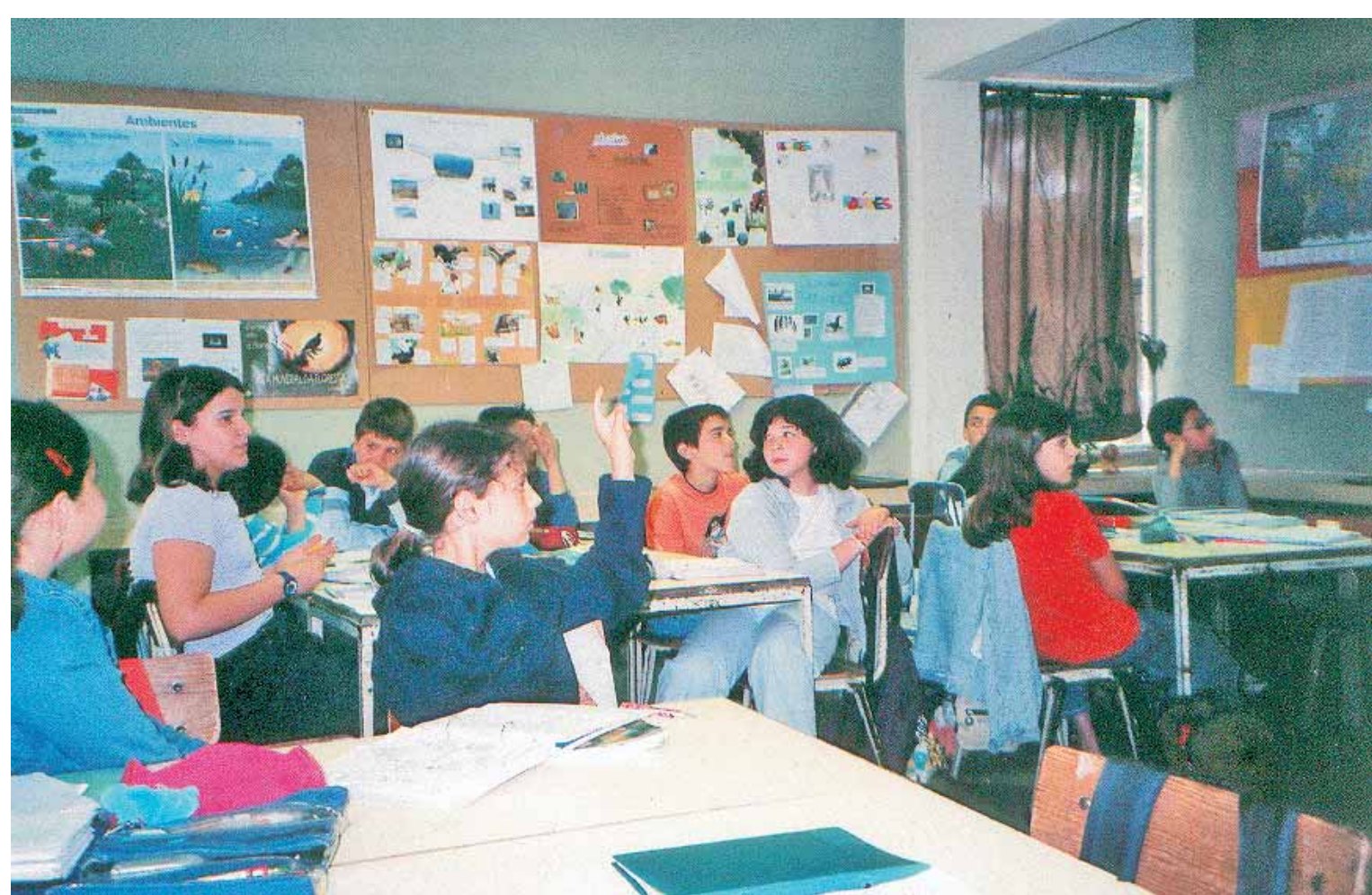
Conselho de cooperação