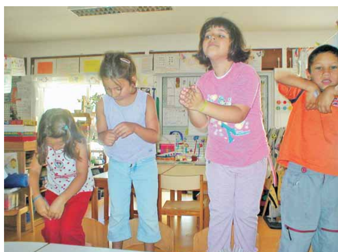
Apresentação de produções