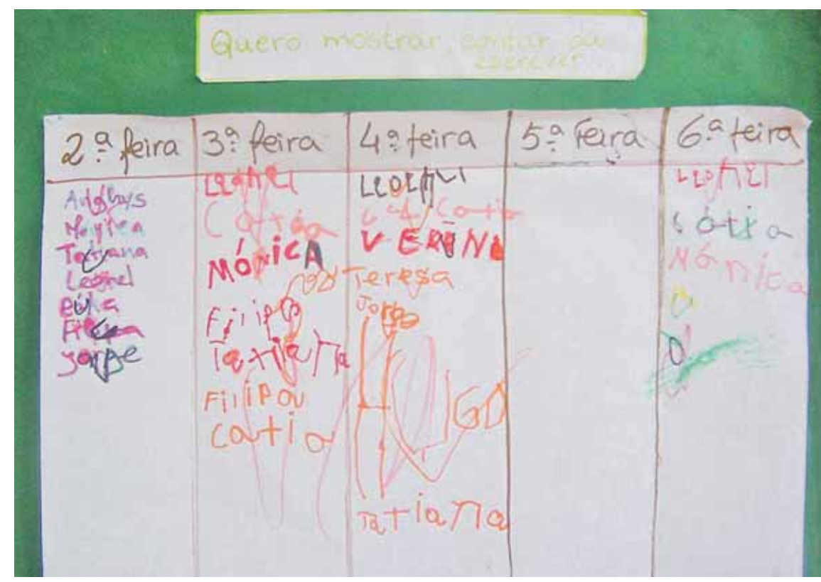
Diálogo de acolhimento