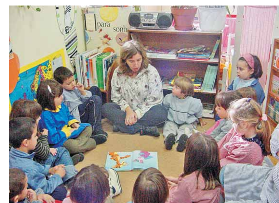
Os Livros e a leitura